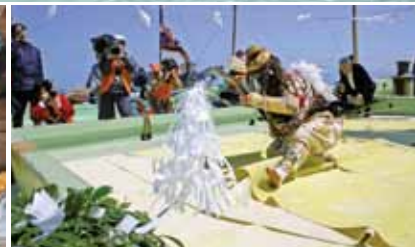
↑ 恵比須舞 (俗称: ボンボコ)