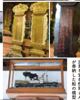
漁業を営む檀家さんが奉納した船の模型