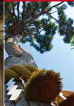
↑片方に枝を広げたご神木の松。 家屋密集地の中のアシ的存在。