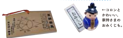
← コロンとかわい、家持さまのおくじも。

力強さとかわいさをあわせ持つ、木彫の狛犬。ふっくらとした尾やたてがみ、クリッとした目で、ゲームのキャラクターにしても違和感はなさそう。地元の天才木彫家・矢野啓通 19歳の時の作品。