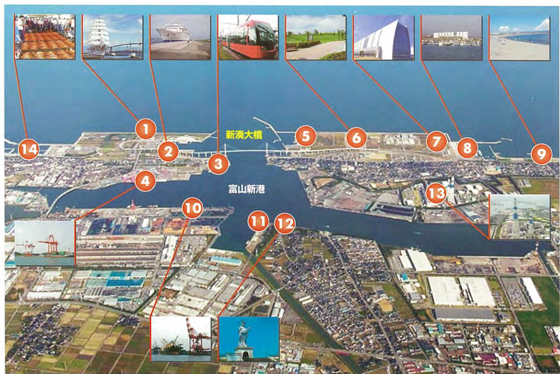
①みなとオアシス海王丸パーク(恋人の聖地(H24認定)) ②海王岸壁(旅客船バース) ③越の潟駅(万葉線終点) ④国際物流ターミナル ⑤近畿大学水産研究所 ⑥元気の森公園 ⑦海電スポーツランド ⑧海電マリナーパーク ⑨海老江海浜公園 ⑩公共岸壁 ⑪富山新港展望台 ⑫新湊弁財天 ⑬火力発電所 ⑭新湊漁港

北陸新幹線の開通、富山新港、臨海工業地域、新湊大橋、立山連峰、海王丸、天然の生簀、四季折々の農作物、そして心づくしのおもてなし、それぞれが、磨き上げ洗練される。