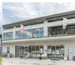
新湊きつときと市場