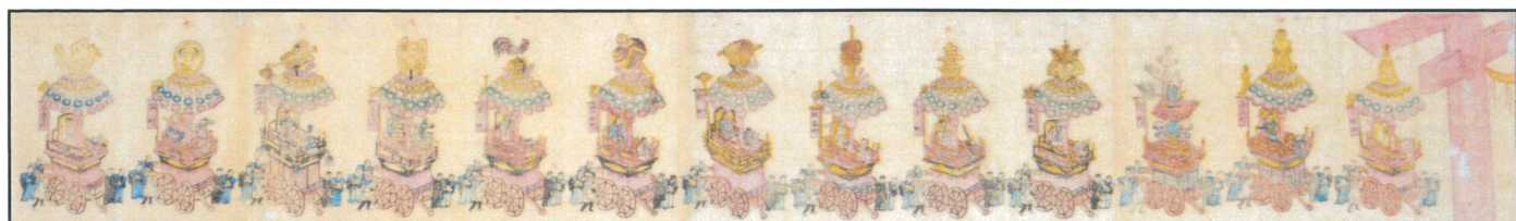
越中国放生津八幡宮祭礼略図 (明治17年)