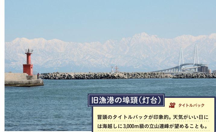
旧漁港の埠頭(灯台) タイトルバック 埠頭のタイトルバックが印象的。天気がいい日には海越しに3,000m級の立山連峰が望めることも。