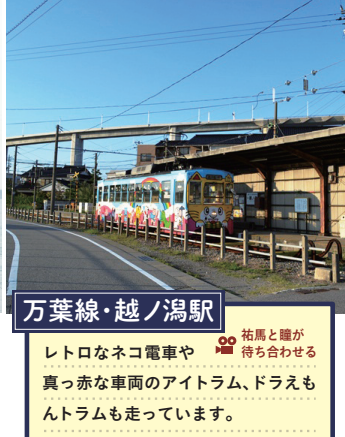
万葉線・越ノ潟駅 祐馬と瞳が待ち合わせる レトロなネコ電車や真っ赤な車両のイトラム、トラも走っています。