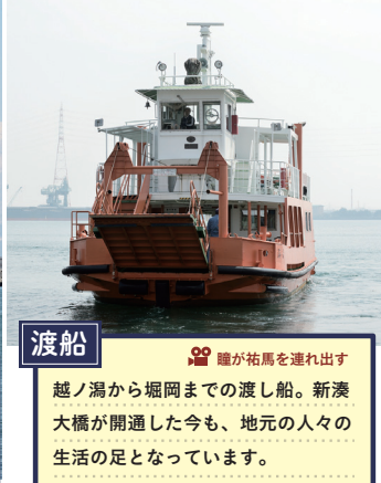
渡船 瞳が祐馬を連れ出す 越ノ潟から堀岡までの渡し船。新湊大橋が開通した今も、地元の人々の生活の足となっています。